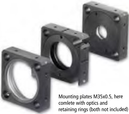
Mounting plates M35x0.5, here complete with optics and retaining rings (both not included)